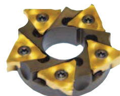
Abbildung: rechtsschneidend, links verzahnt Anzugs-Drehmoment = 3 Nm

Bohrung (D1) mit Längsnut nach DIN 138 bore (D1) with longitudinal keyway to DIN 138