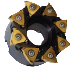
Abbildung: rechtsschneidend, links verzahnt Anzugs-Drehmoment = 3 Nm