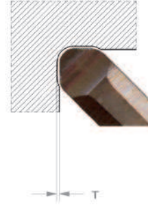
Ansicht X vergrößert Abmessungen in mm